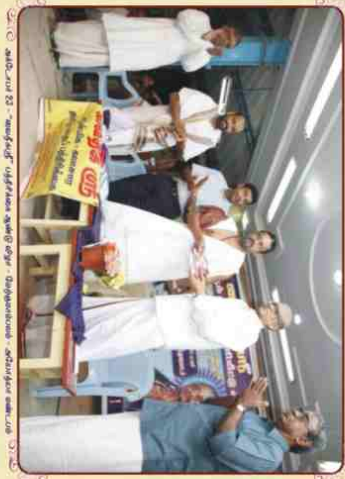
மதுரமுரசின் உதவியுடன் நடைபெற்ற சமூக சேவை நிகழ்ச்சி

Published by S.Srinivasan on behalf of Guruji Sri Muralithera Swamigal Mission, New No.2, Old No.24, Netaji Nagar, Jafferkhanpet, Chennai - 600083 and Printed by Mr.R.Kumaravel of Rajthilik Printers, 1/545A, Sivakasi Co-Op Society Industrial Estate, Sivakasi. Editor: S.Sridhar